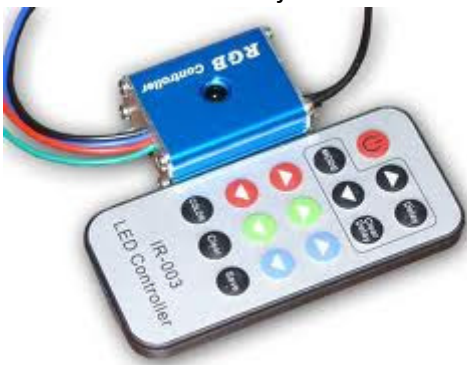
Controller bij RGB set