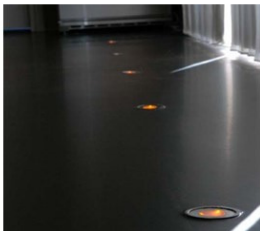
Verwerkt in een gietvloet