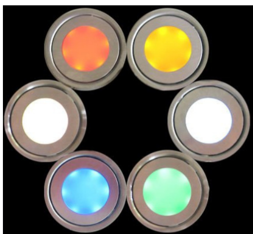
Leverbaar in 6 vaste kleuren of RGB